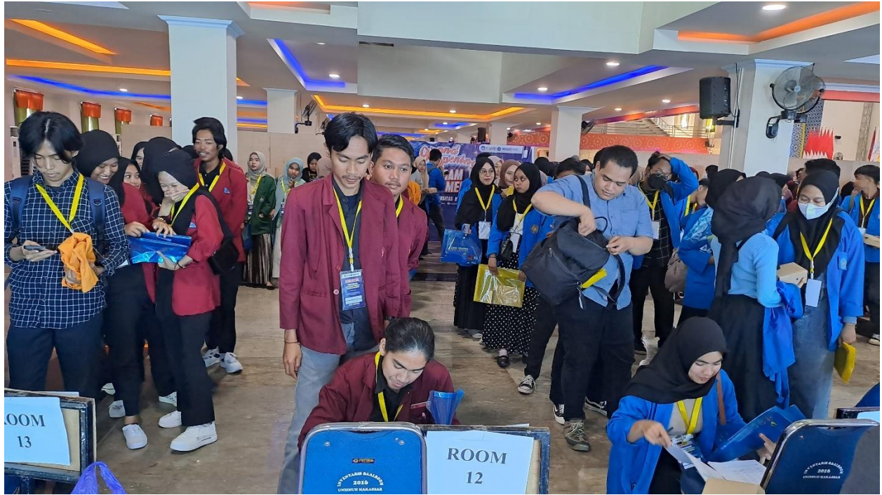
Gambar 3. Registrasi WMK Unismuh Makassar 2023