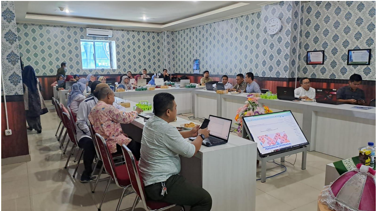
Gambar 3. Aula Mini Hall Fakultas Teknik di Lantai 3 Gedung Iqra