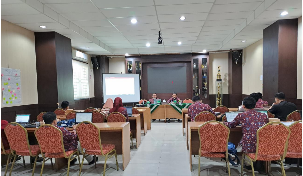
Gambar 6. Mini Hall UBC di Lantai 2 Gedung Iqra