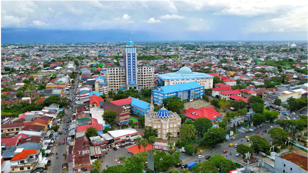
Gambar 1. Gedung Infrastruktur di Universitas Muhammadiyah Makassar

Jumlah tenaga pendidik Universitas Muhammadiyah Makassar yang tercatat di PDPT Dikti sebanyak 765 orang yang tersebar di 51 Program Studi. Sedangkan jumlah tenaga kependidikan sebanyak 243 yang ditempatkan di masing-masing unit kerja. Sebagian besar tenaga kependidikan telah bersertifikat profesi sesuai dengan bidang kompetensinya. Dalam rangka menunjang program wirausaha merdeka yang diusulkan, Universitas Muhammadiyah Makassar telah memiliki infrastruktur yang sangat memadai untuk mendukung kelancaran Program Wirausaha Merdeka periode 2 tahun 2023.