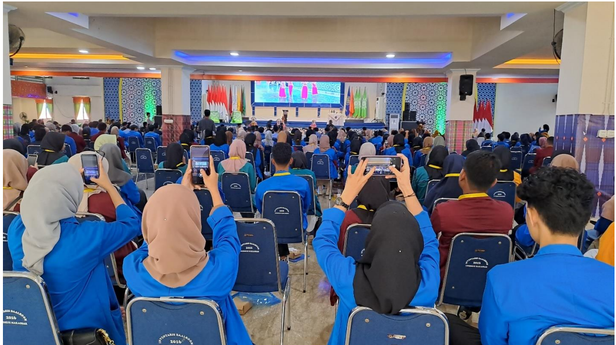
Gambar 4. Registrasi WMK Unismuh Makassar 2023