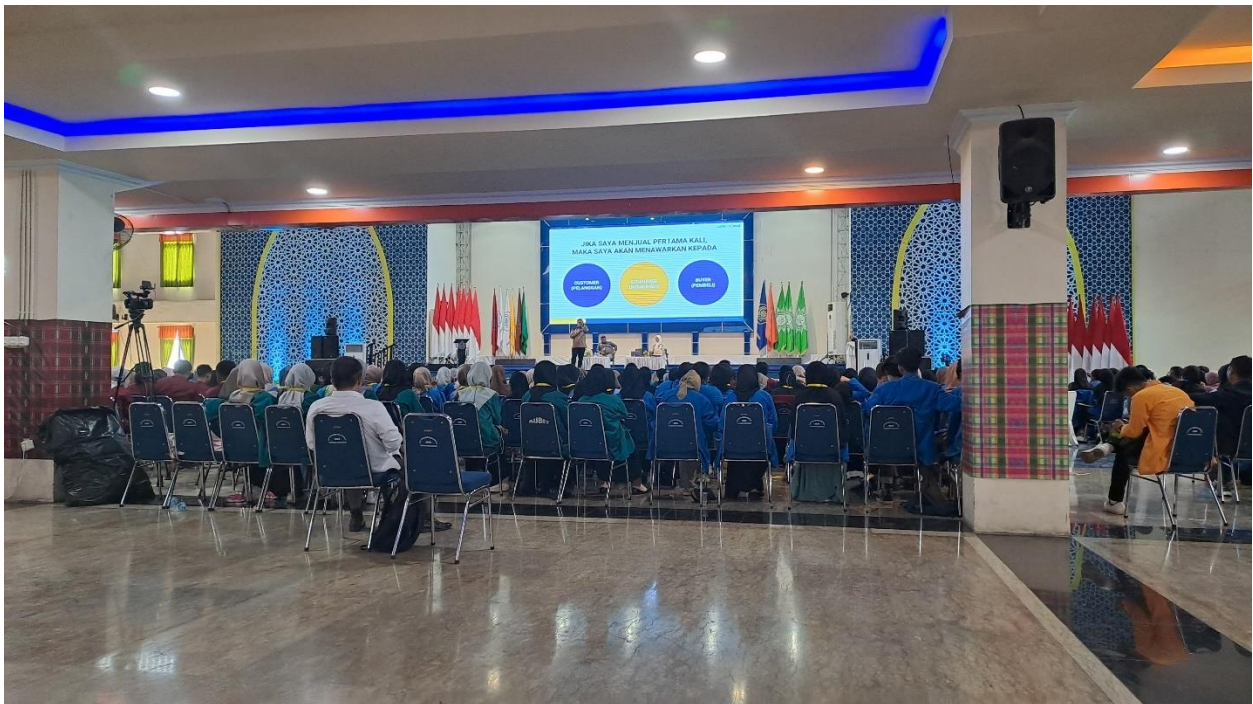
Gambar 2. Pembukaan WMK Unismuh Makassar 2023