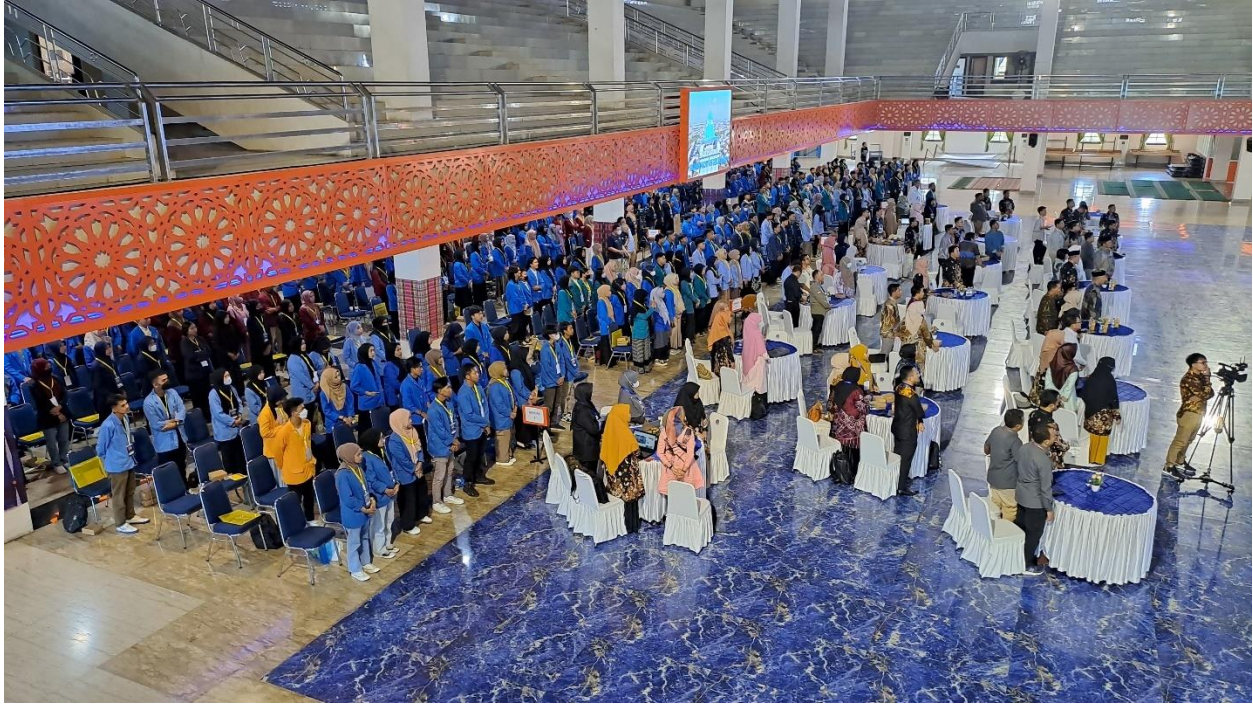
Gambar 1. Pembukaan WMK Unismuh Makassar 2023