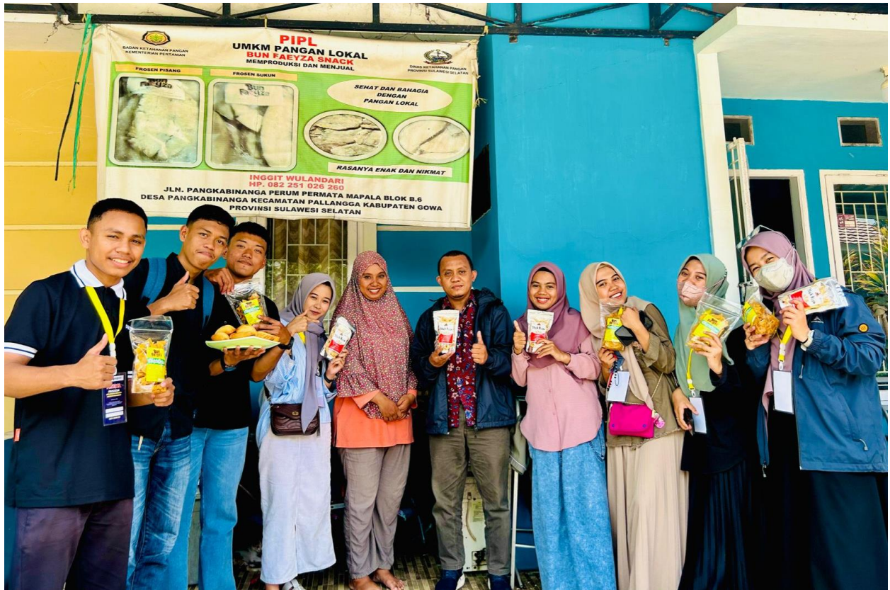
Gambar 5. Kegiatan Kunjungan ke Mitra WMK Unismuh Makassar 2023