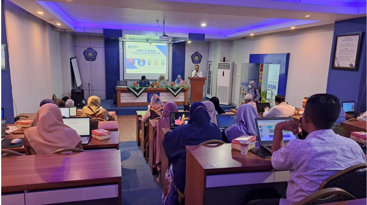
Gambar 2. Aula Mini Hall FEBIS di Lantai 8 Gedung Iqra