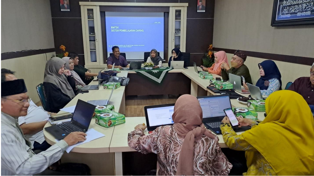
Gambar 4. Ruang Rapat Pascasarjana di Lantai 2 Gedung Pascasarjana