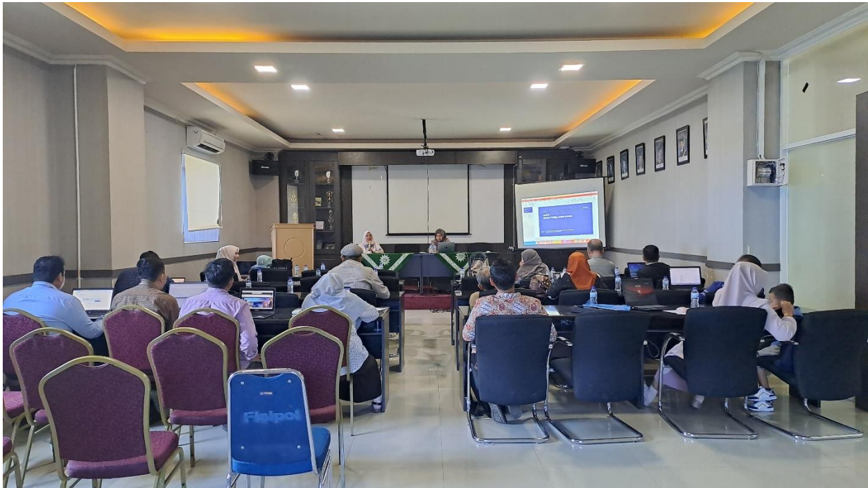
Gambar 5. Aula Mini Hall FISIPOL di Lantai 5 Gedung Iqra