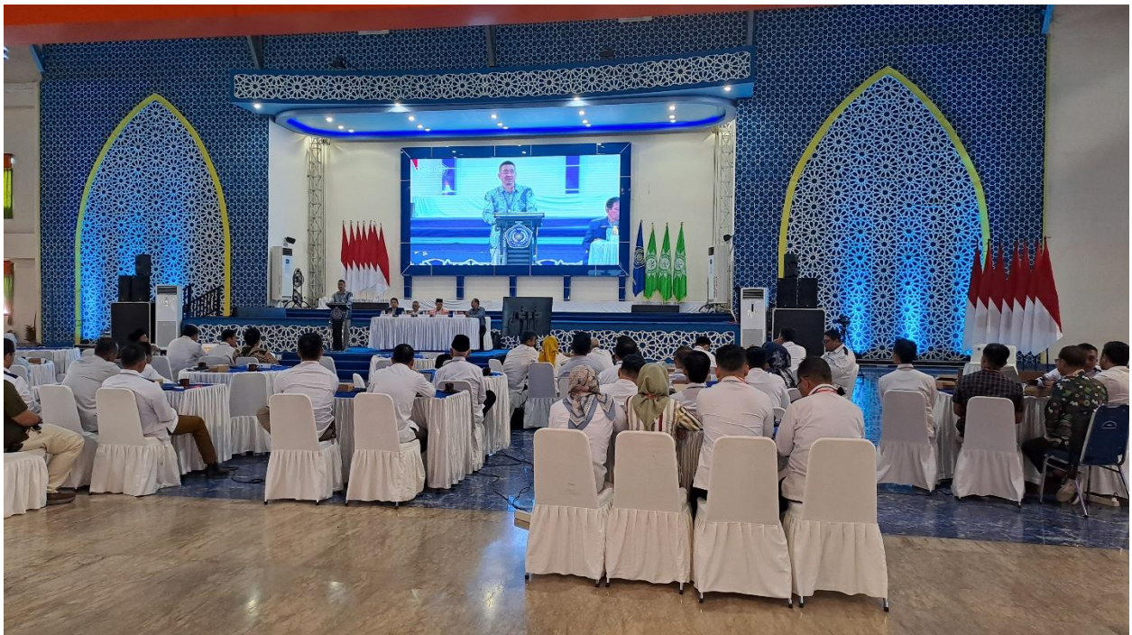
Gambar 7. Balai Sidang Muhktamar ke 47 Lantai 3