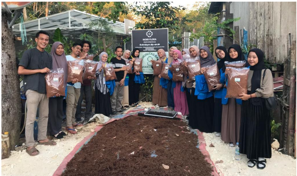
Gambar 6. Kegiatan Kunjungan ke Mitra WMK Unismuh Makassar 2023